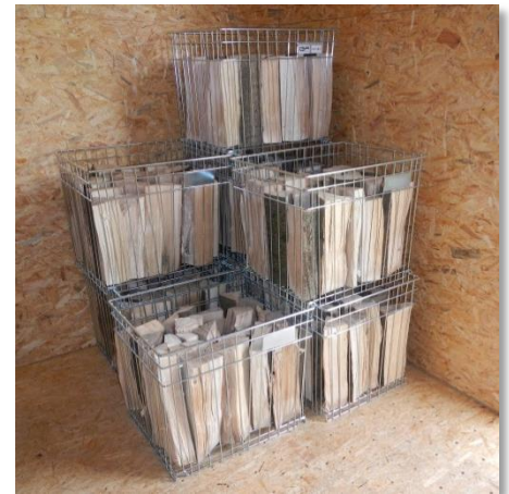
Option: Stapelkörbe für Trocknung

Ferner wird sie auch als Kleingebäude, z.B. für Sattel- und Futterkammern, nachgefragt. Diese Kleingebäude stellen einen trockenen, temperierten und gut durchlüfteten Raum zur allgemeinen Nutzung bereit und das unabhängig von der Vorort verfügbaren Infrastruktur.