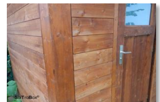
Option: N+F Verkleidung